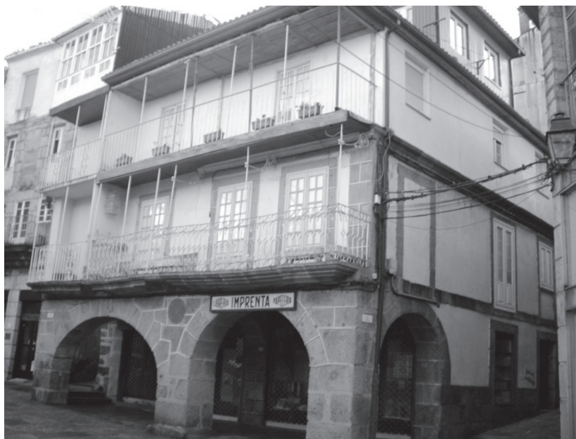
Figura 32. Imprenta El Ribadaviense en febrero de 2017.