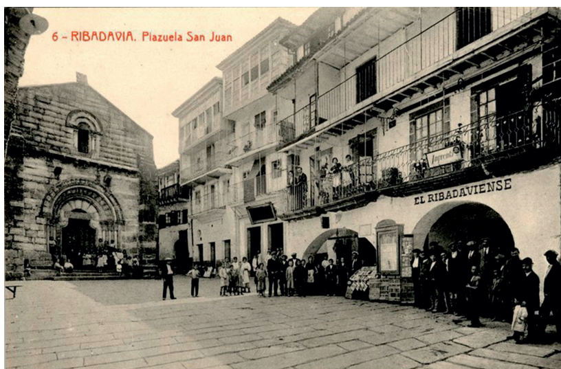
Figura 31. Imprenta El Ribadaviense, Plazuela de San Juan (Ribadavia). Años treinta del siglo XX.